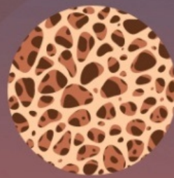
Кость при остеопорозе